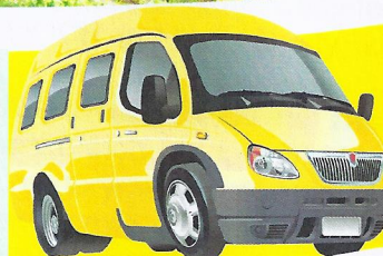
Zmena programu vyhradená